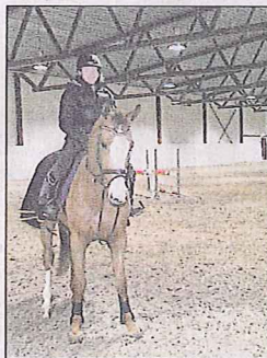
BEHOV: Hestefolket har klart signalisert behov for ridehall

For å få flere til å svare på undersøkelsen blir spørreskjemaet liggende ute på Hesteriketets nettsider enda en stund.